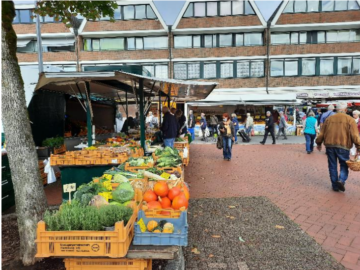
Abb. 7: Angebote am Wochenmarkt