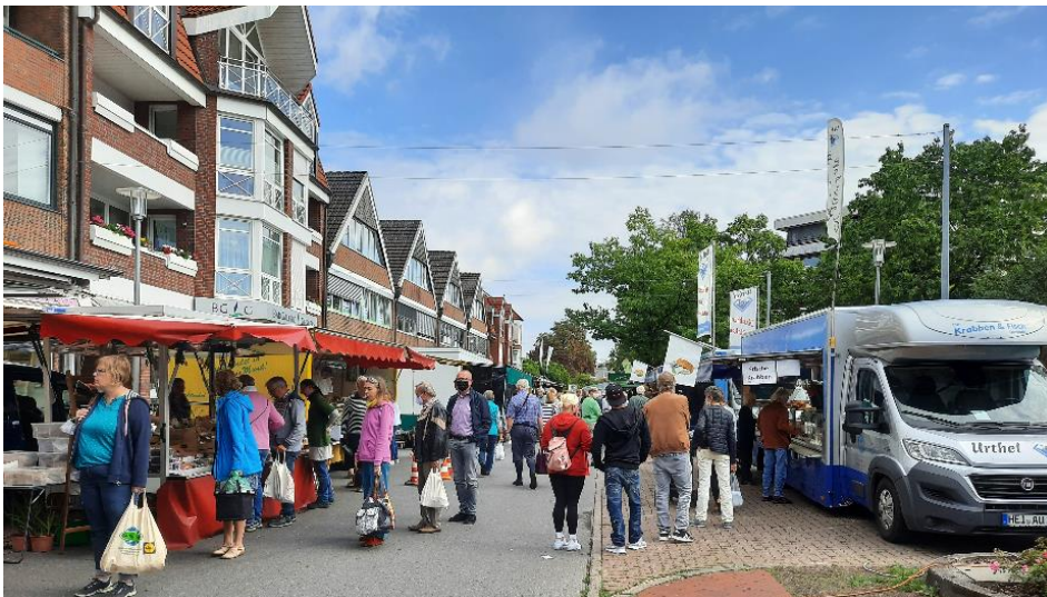
Abb. 6: Wochenmarkt

Der Wochenmarkt findet jede Woche auf dem Marktplatz statt, welchen Sie auf dieser Seite sehen können. Auf dem Markt werden vorwiegend frische Nahrungsmittel wie Obst, Gemüse, Kräuter, Milchprodukte, Fisch und Fleisch angeboten, aber auch Bekleidung oder Blumen können dort erworben werden. Bilder von dem Markt finden Sie im Link zu den Abbildungen 6 und 7 oder aber Sie können diesen jeden Freitag von 7 bis 15 Uhr selbst erleben. Der Markt ist vor allem bei der älteren Generation beliebt, was auch möglicherweise durch die gewählte Uhrzeit hervorgerufen wird, da viele Beschäftigte zu dieser Zeit noch arbeiten.