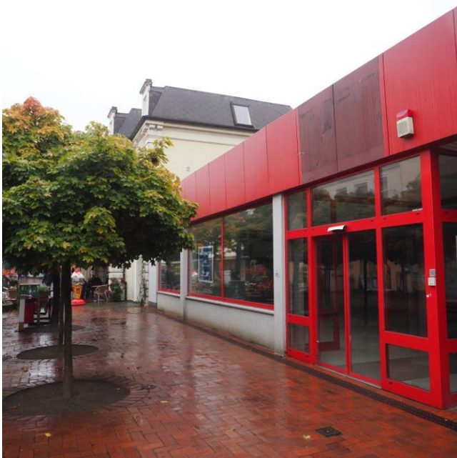
Abb. 2: Leerstand Penny außen