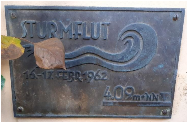
Abb.1: Hochwassermarke am Pressehaus

Wenn Sie in die Straße „Großer Sand“ gehen, ist in circa 60 Metern auf der linken Seite das Pressehaus (Großer Sand 1-3, 25436 Uetersen) der Uetersener Nachrichten zu sehen. Dort finden Sie links unten am Eingang eine Markierung, die den Wasserstand vom 17.02.1962 abbildet. Die Flutwelle verursachte damals einen Schaden von ungefähr 30 Millionen DM, der Kreis Pinneberg hatte aber keine Todesopfer zu verzeichnen.