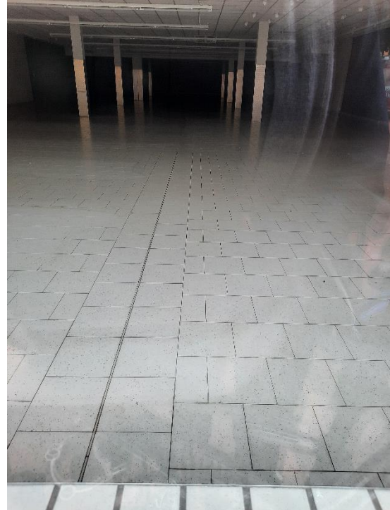
Abb. 3: Leerstand Penny innen